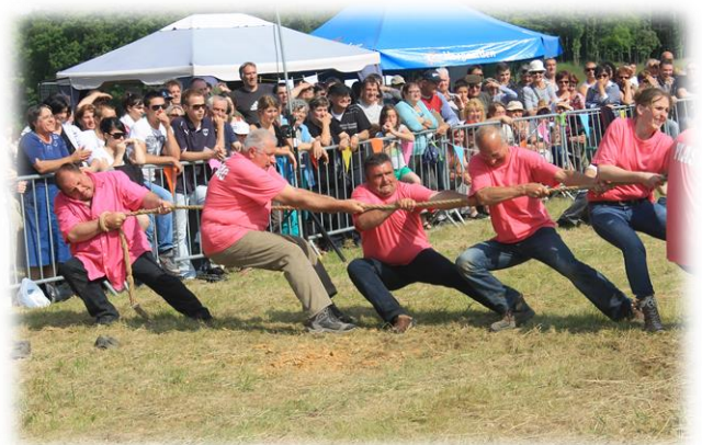
L'équipe en plein effort !