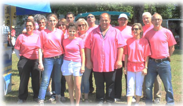
L'équipe de Plassac