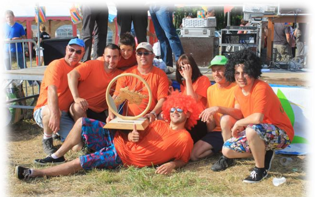
L'équipe gagnante : GIVREZAC