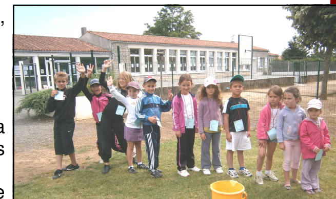
Journée sportive du RPI