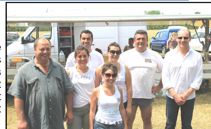
Equipe de Plassac et Monsieur le maire (à droite)

Le 2 juin a eu lieu la 5 ème édition de la fête cantonale à Saint Georges d'Antignac. Tous les ans, les communes du canton se retrouvent et s'affrontent lors de jeux d'agilité et sportifs. L'équipe de Plassac était composée de 6 participants : 3 filles et 3 garçons.